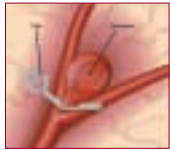
Aneurisma tratado con colocación de clips