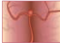
Crecimiento aneurismático en un vaso