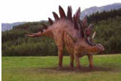
Museo Jurásico de Asturias - MUJA Colunga (Asturias)

Es accesible exepcto en puntos muy concretos donde existen bordillos en cruces de carreteras sin arcen.