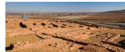
Centro de interpretación Cerro de las Cabezas

La Posada de los Portales de la localidad de Tomelloso, es un bonito ejemplo de arquitectura popular edificado a mediados del siglo XVII, con soportales de madera y estructura de una típica venta manchega, que ha sido escenario de algunas aventuras del genial detective Plinio, creado por el escritor Francisco García Pavón.