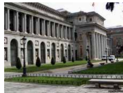
MUSEO DEL PRADO

El propósito del Museo de la Ciudad es explicar el desarrollo histórico de la ciudad, así como las infraestructuras que la conforman a través de vídeos, planos, maquetas, pantallas interactivas, etc.