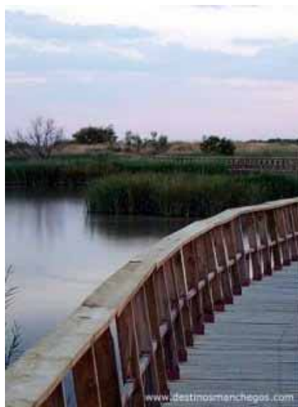
PARQUE NACIONAL TABLAS DE DAIMIEL