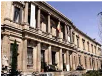
MUSEO ARQUEOLOGICO NACIONAL

El Auditorio Nacional de Música es un organismo dependiente del Instituto Nacional de las Artes Escénicas y de la Música (Ministerio de Cultura). Obra del arquitecto José M a García de Paredes, fue inaugurado el 21 de octubre de 1988 y su construcción fue programada dentro del Plan Nacional de Auditorios, destinado a dotar al país de una adecuada infraestructura musical.