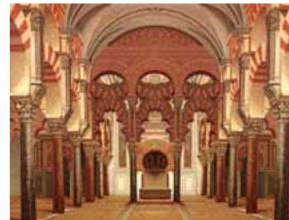
Catedral de Córdoba (Antigua Mezquita)

Córdoba supo del hombre desde el Paleolítico; los Turdetanos la convirtieron en capital del Imperio de Tartesos; la conquistó para el cartaginés el general Amílcar Barca; fue romana dos siglos antes de Cristo, en la que nacieron y vivieron Séneca y Lucano; luego la dominó Bizancio, como después los visigodos de Leovigildo.